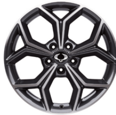
18 "diamond cut alumijske felne