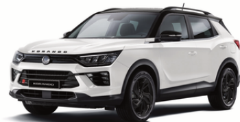
Crni paket (primer sa Grand bela)