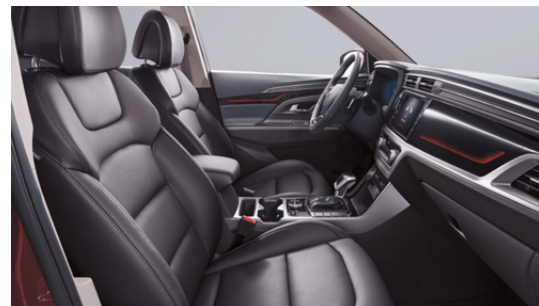
CRNI - crni dizajn enterijera i presvlake sedišta