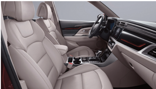
BEIGE - bež dizajn enterijera i presvlake sedišta