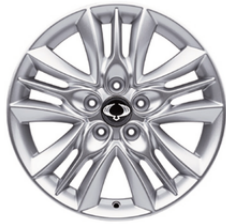
17 "alumijske felne