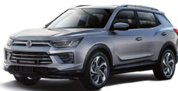
Iron metal, metalik