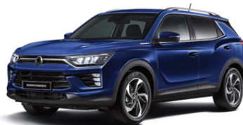
Dandy plava, metalik