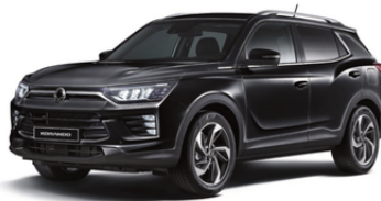
Space crna, metalik