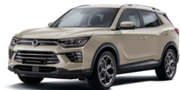
Latte bež, metalik