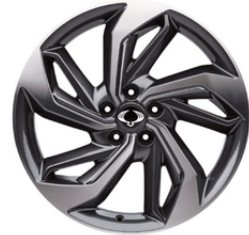
19 "crne diamond cut alumijske felne