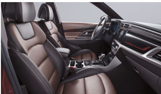
SMEĐA sedišta od prave kože i dizajn enterijera - samo u kombinaciji sa Premium Plus paketom, ne i sa Crni paketom