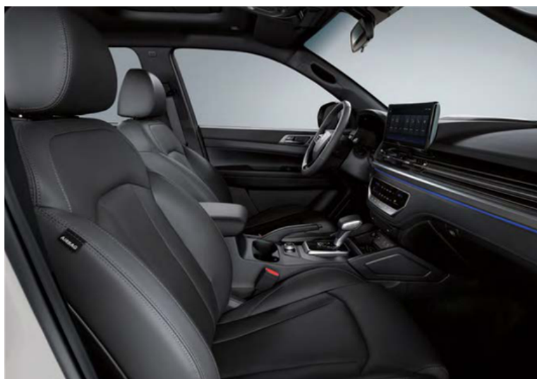
Crni tekstil i oblog stropa / Crna koža i crni oblog stropa