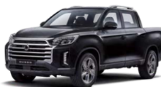
Space crna, metalik