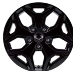
18 "crne aluminijske felne