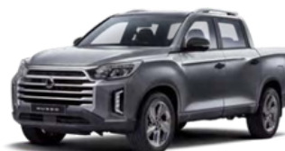
Marble siva, metalik