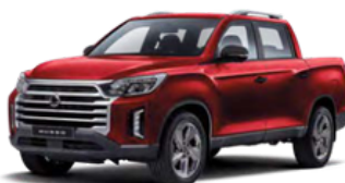
Indian crvena, metalik