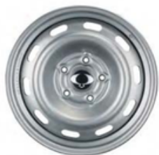
17 "čelične felne