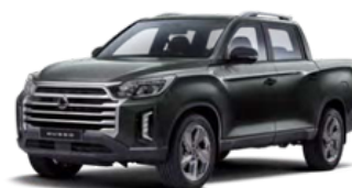
Amazonia zelena, metalik