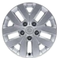
17 " aluminijske felne