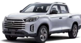
Silky bela, metalik