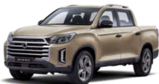
Sand bež, metalik