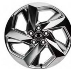
20 "sputtering aluminijske felne