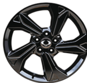
18 "crne diamond cut alumijske felne