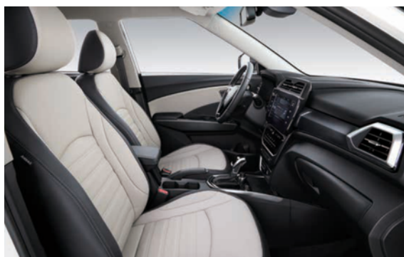
Soft bež/siva tekstilna presvlaka