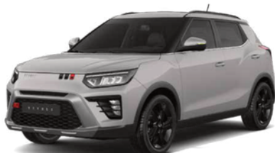
Latte bež, metalik