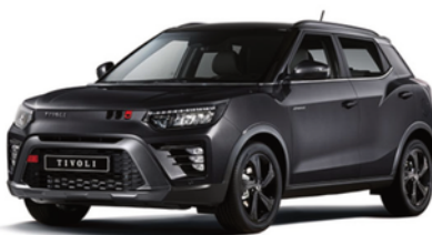
Space crna, metalik