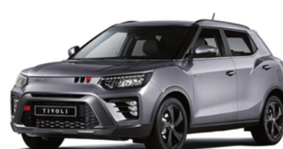
Iron metal, metalik