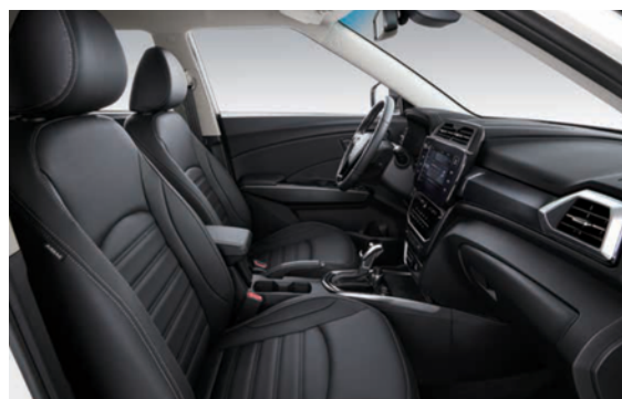
Crna tekstilna presvlaka