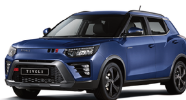
Dandy plava, metalik