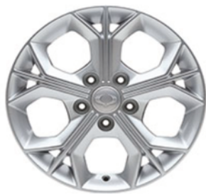
16 "alumijske felne