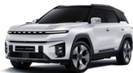
Grand bela - dve boje