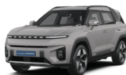
Latte bež, metalik