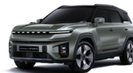
Forest zelena, metalik - dve boje