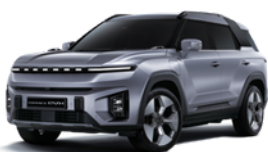
Iron metal, metalik