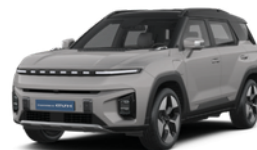
Latte bež, metalik - dve boje