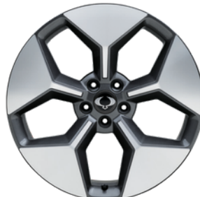
20 "diamond cut alumijske felne