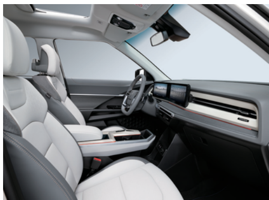
Teal siva + bež belo ravno tkanje