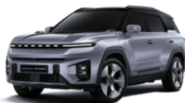
Iron metal, metalik - dve boje