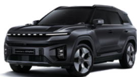
Space crna, metalik