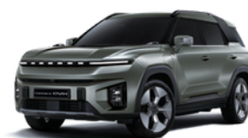
Forest zelena, metalik