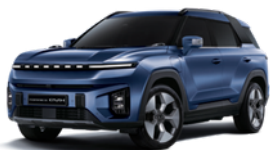
Dandy plava, metalik