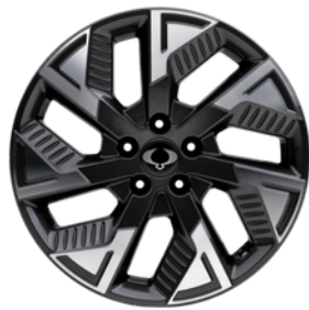
18 "diamond cut alumijske felne